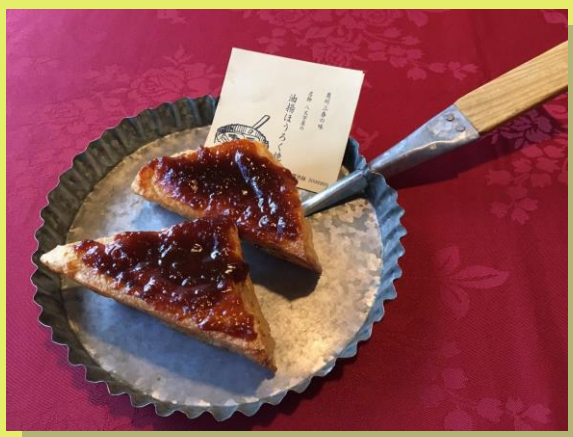
名物油揚ほうろく焼 2枚入り