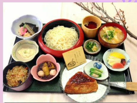
※季節により食材が変わります